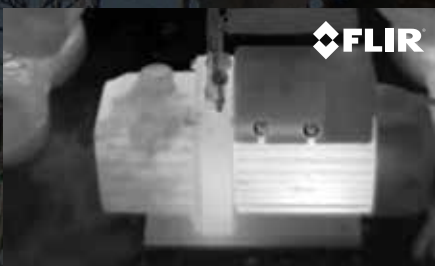
COMPRESSOR DE AR-CONDICIONADO - IMAGEM DE INFRAVERMELHO