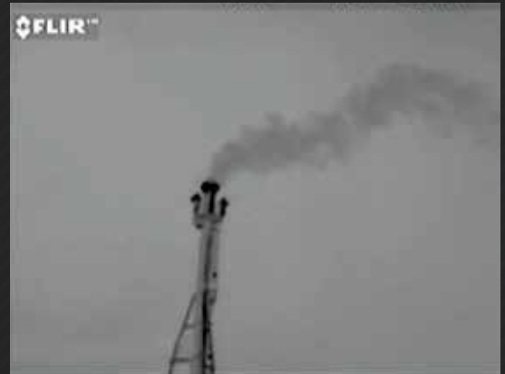
VEJA VAZAMENTOS DE HIDROCARBONETOS COM NITIDEZ

De extração de gás natural a operações petroquímicas e de geração de energia, as empresas economizaram mais de US$ 10 milhões por ano ao evitar desperdício de produtos com a adição das imagens ópticas de gás da FLIR à detecção e ao reparo de vazamentos (LDAR).