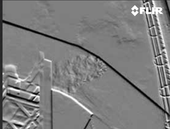
ENCONTRE VAZAMENTOS EM USINAS SIDERÚRGICAS

Verifique se há vazamentos de hexafluoreto de enxofre (SF 6 ) nos disjuntores de subestação, a partir de uma distância segura das áreas de alta tensão, sem necessidade de interromper as operações.