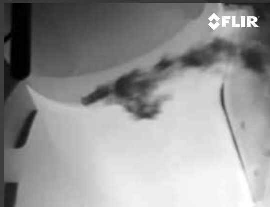
DETECTE VAZAMENTOS DO COMPRESSOR R-124

Evite paralisações ao detectar vazamentos de dióxido de carbono (CO 2 ) logo nos primeiros estágios da produção química, manufatura e programas de recuperação de petróleo.