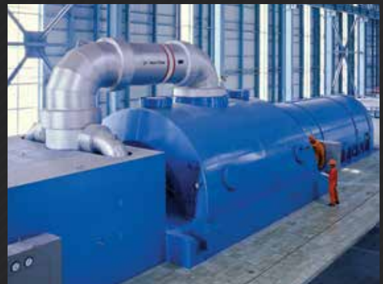
DETECTE VAZAMENTOS EM GERADORES REFRIGERADOS POR HIDROGÊNIO

Examine rapidamente milhares de conexões e verifique se há vazamentos de gás natural (metano) e hidrocarbonetos; faça isso a partir de uma distância segura para evitar violações de regulamentos, multas e perda de receita.