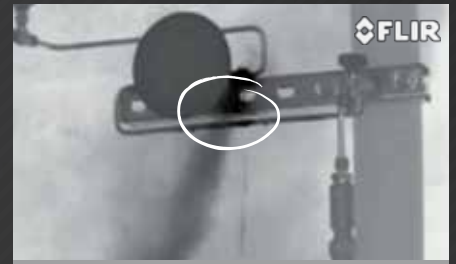
UM MANÔMETRO VAZANDO