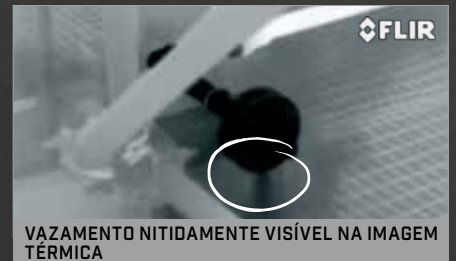
VAZAMENTO NITIDAMENTE VISÍVEL NA IMAGEM TÉRMICA