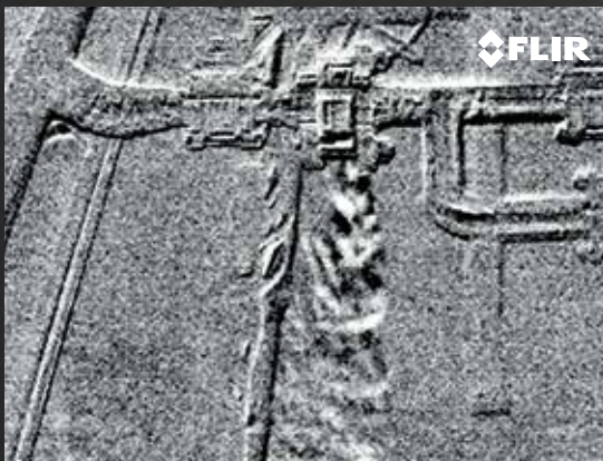
DETECTE VAZAMENTOS DE CO 2 DIFÍCEIS DE ENCONTRAR

Proteja os trabalhadores e o ambiente de níveis tóxicos de monóxido de carbono (CO) localizando com precisão os vazamentos de forma rápida e eficiente.