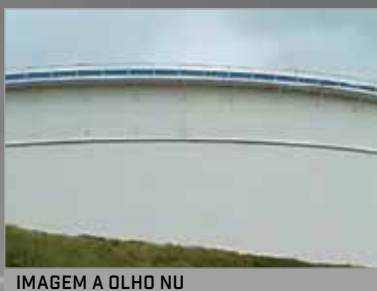
IMAGEM A OLHO NU