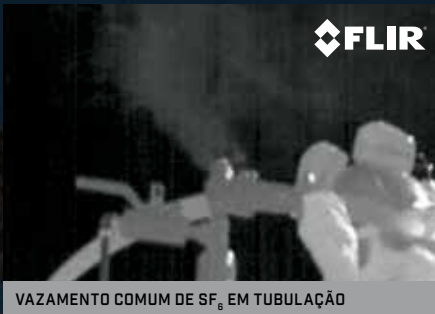
VAZAMENTO COMUM DE SF 6 EM TUBULAÇÃO