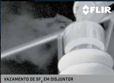
VAZAMENTO DE SF 6 EM DISJUNTOR