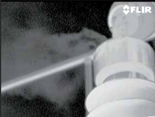
ENCONTRE FACILMENTE VAZAMENTOS DE SF 6