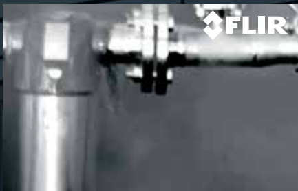
VAZAMENTO DE CO 2 - IMAGEM DE INFRAVERMELHO