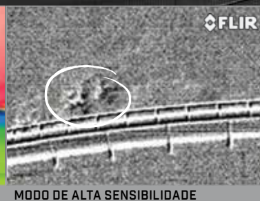
MODO DE ALTA SENSIBILIDADE