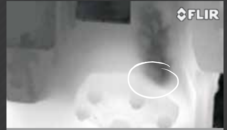
VAZAMENTO DE GÁS DETECTADO