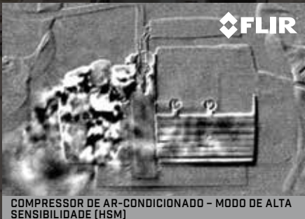
COMPRESSOR DE AR-CONDICIONADO - MODO DE ALTA SENSIBILIDADE (HSM)