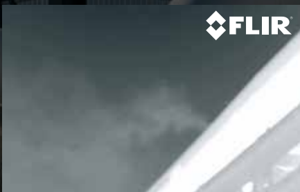
EMISSÕES DE ALTO-FORNO