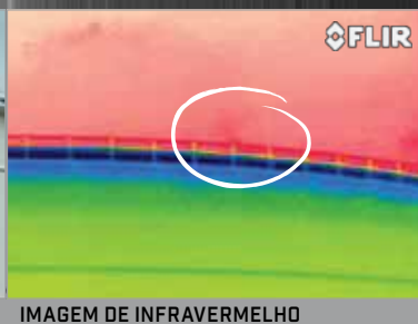
IMAGEM DE INFRAVERMELHO